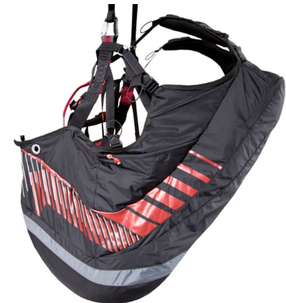
Errors and omissions expected. Subject to change without notice. Reproduction in whole or in part without written permission of U-Turn GmbH is prohibited. Irrtümer, Druckfehler und Änderungen bleiben vorbehalten. Nachdruck auch auszugsweise, nur mit schriftlicher Genehmigung der U-Turn GmbH.