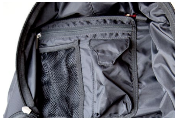
Generously dimensioned back compartment with additional inside pockets. Großzügig dimensioniertes Rückenfach mit zusätzlichen Innenfächern.