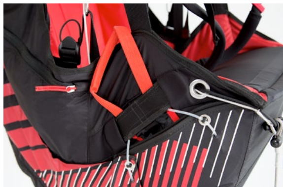
Easypull rescue container with ergonomic release handle. Easypull Rettungscontainer mit ergonomischem Auslösegriff.